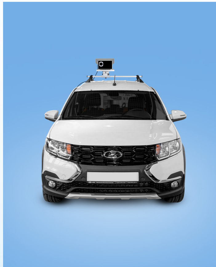
Мобильное (на крыше патрульного автомобиля)