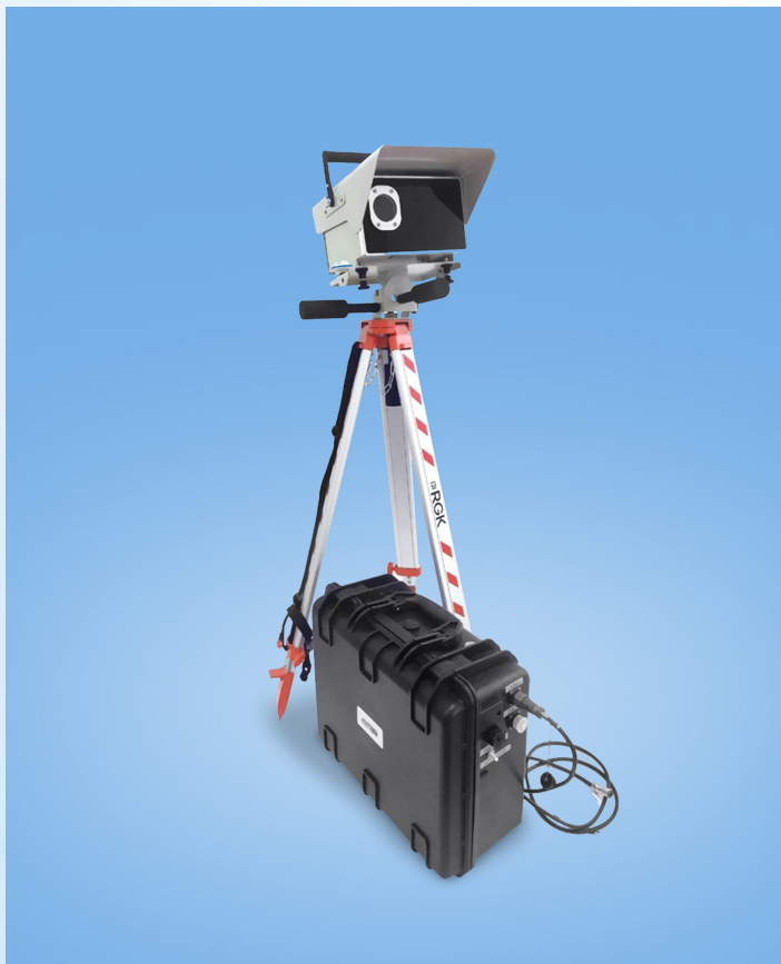
Передвижное (на треноге)